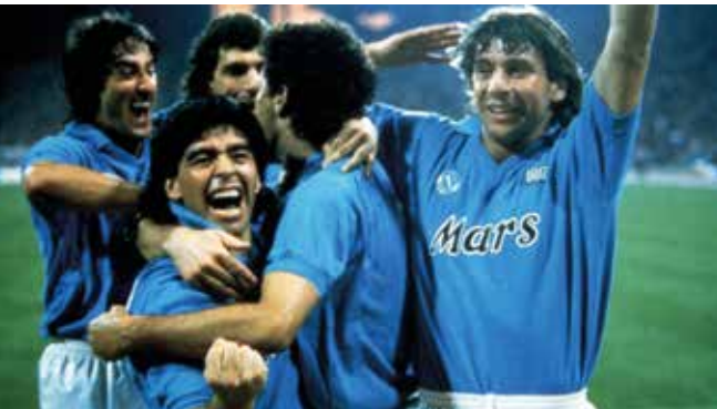
DIEGO MARADONA: Maradona mit dem SSC Neapel beim Gewinn des UEFA-Cups 1989

Am 5. Juli 1984 wechselte Maradona von Barcelona nach Neapel – für eine beispiellos hohe Ablösesumme. Der gefeiertste Fußballspieler der Welt und die hitzigste Stadt Europas schienen sich perfekt zu ergänzen. Es war der Stoff, aus dem Träume gemacht sind. Aber die Realität holte ihn ein. Porträt von Asif Kapadia („Amy“, „Senna“) über die legendäre „Hand Gottes“.